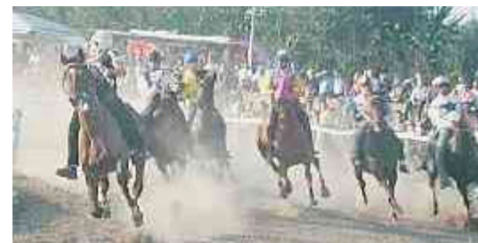
Una fase dello spettacolare di Santa Croce che è stato seguito da un folto e appassionato pubblico