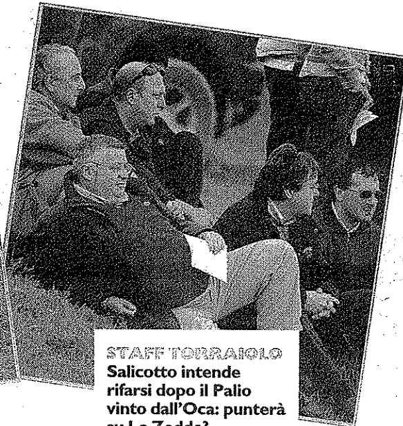
STAFF TORRAIOLO Salicotto intende rifarsi dopo il Palio vinto dall'Oca: punterà su Lo Zedde?